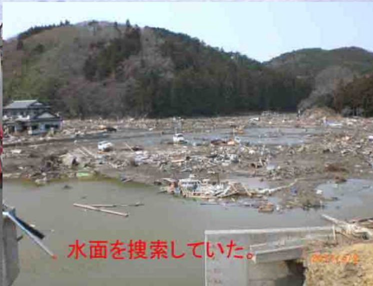
水面を搜索していた。