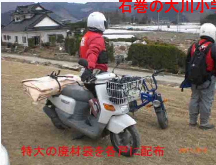
特大の廃材袋を各戸に配布