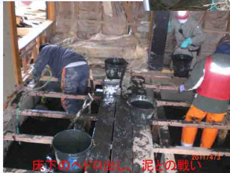
床下のへドロ出し、泥との戦い