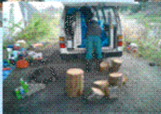
カットした流木は手作業で運び出しました。

台風・地震などで河川の氾れ出した流木は橋の損傷及び農業への影響が大きい。この流木をカット搬出する作業をチェーンソーを使用していました。