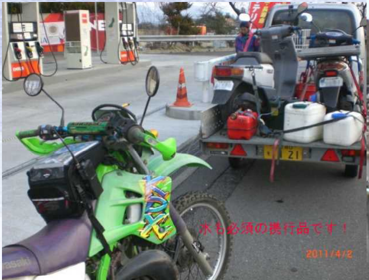
水も必須の携行品です！