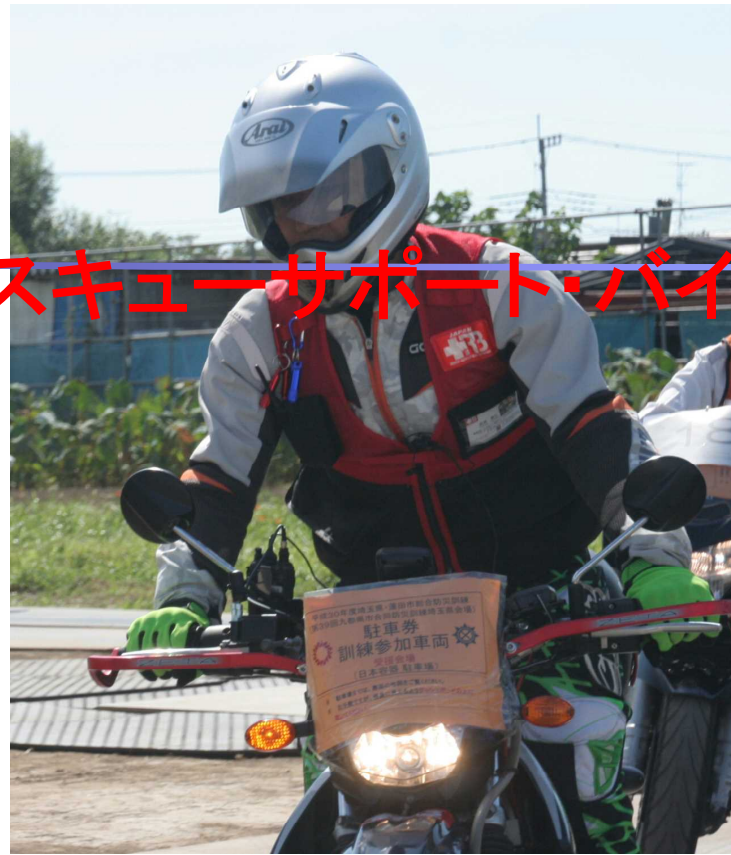
2018年蓮田市、9都県合同防災訓練会場での埼玉RB隊員の走行