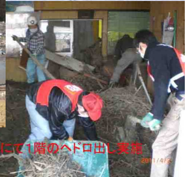
大須にて1階のへドロ出し実施