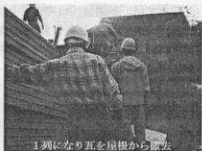
1列になり瓦を屋根から撤去

業者の方から、まだ、次の家も沢山あり、手伝ってもらって大変助かると感謝の言葉をもらう。瓦の撤去の間、思い