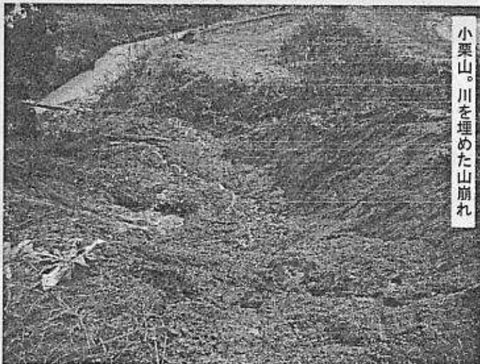
小栗山。川を埋めた山崩れ

当日は朝から忙しい、9時に小千谷のボラセンにて小栗山に入るボランティアと合流するからだ。起床後・・・水害セットの長靴にゴアの合羽などを着こみ簡単に食事をして昨日と同じメンバーとともにハイエースに乗り込む。