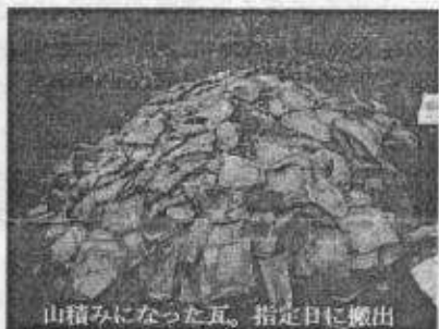
山積みになった瓦。指定日に搬出