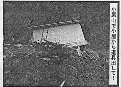
小栗山で小屋から道具出して！

川口町、小千谷のボラセンを回る。小千谷のボラセンは終了して、ボランティアの業務が社会福祉協議会に移行してい