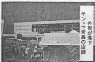
外壁が落下 テントで営業の店舗