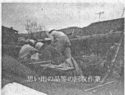
思い出の品等の回収作業

出の品を回収する作業も忘れてはならない、業者では出来ない作業でまさにボランティアの仕事。午後16時ボラセンに戻り報告。