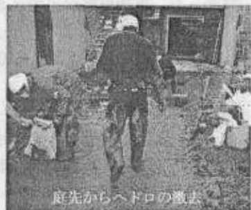
庭先からヘドロの撤去