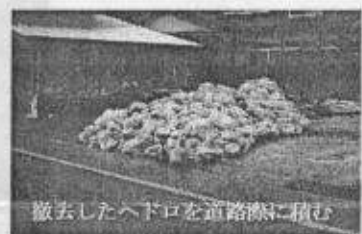
撤去したヘドロを道路側に積む